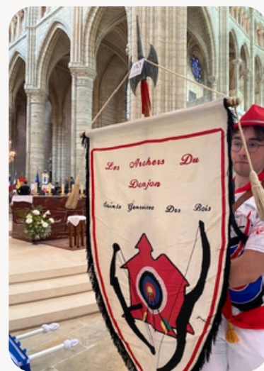
Notre bannière actuelle

Certains d'entre vous nous ont déjà fait part d'esquisses et de projets, un grand merci pour vos contributions !