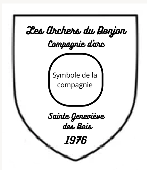
Un exemple d'agencement des éléments importants

Afin de réaliser une bannière à l'image de la compagnie certains éléments ont été retenus par les membres du bureau pour vous guider. Les éléments importants sont les suivants : Le nom de la ville, l'année de création, le nom de la compagnie, un symbole représentant la compagnie.